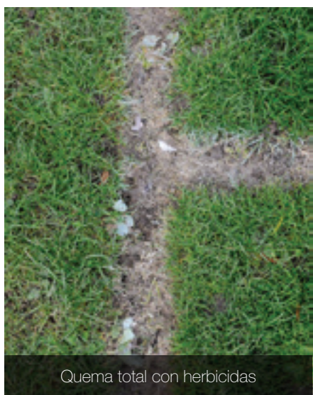
Quema total con herbicidas